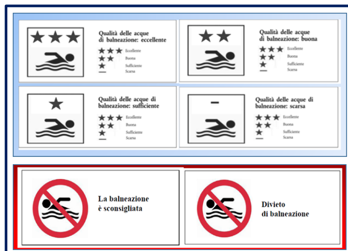
Figura. 1.1. – Simboli approvati dalla Commissione Europea per l’informazione al pubblico in merito alla classificazione delle acque di balneazione.

Ad ogni classe di qualità è stata associata dalla Commissione Europea (Decisione 2011/321/UE) una opportuna simbologia (Fig. 1.1). In dettaglio, le aree classificate come “eccellente”, “buona” e “sufficiente” sono idonee alla balneazione. Al contrario, le aree in qualità “scarsa” dovranno essere sottoposte a misure di gestione adeguate, tra cui anche il temporaneo divieto alla balneazione, atte a determinare un miglioramento della qualità delle acque. Tali aree devono inoltre essere opportunamente segnalate.