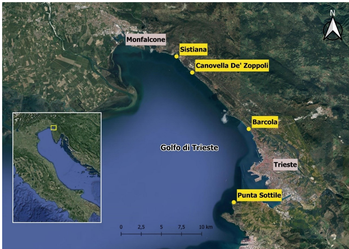
Figura. 5.1 - Località e i punti di campionamento del programma di monitoraggio marino costiero per la gestione della qualità delle acque di balneazione in relazione alla presenza di specie potenzialmente tossiche (modificata da Google Earth).

Durante la stagione balneare 2025 il monitoraggio è stato eseguito in fase di routine secondo le linee guida vigenti. O. cfr. ovata è stata riscontrata a partire dal campionamento del 18 agosto prevalentemente nella matrice macroalgale in quasi tutte le stazioni monitorate fino alla fine della stagione balneare.